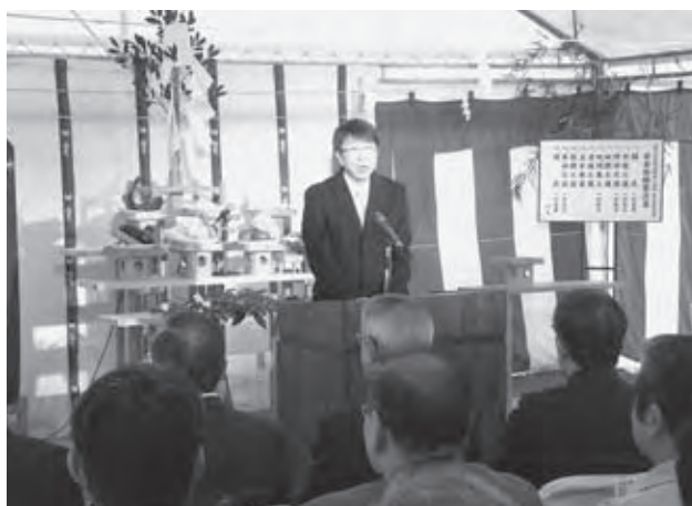
あいさつする中貝管理者