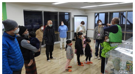
【クリーンパーク北但は5つの役割を持つ複合施設です。希望者はイベント終了後に施設内見学ができます。】