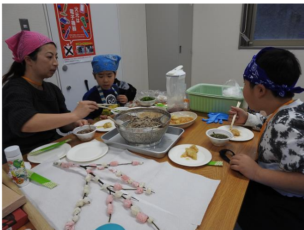
【いただきます！ そばもちも美味しい！ 大人も子どもも大満足です】