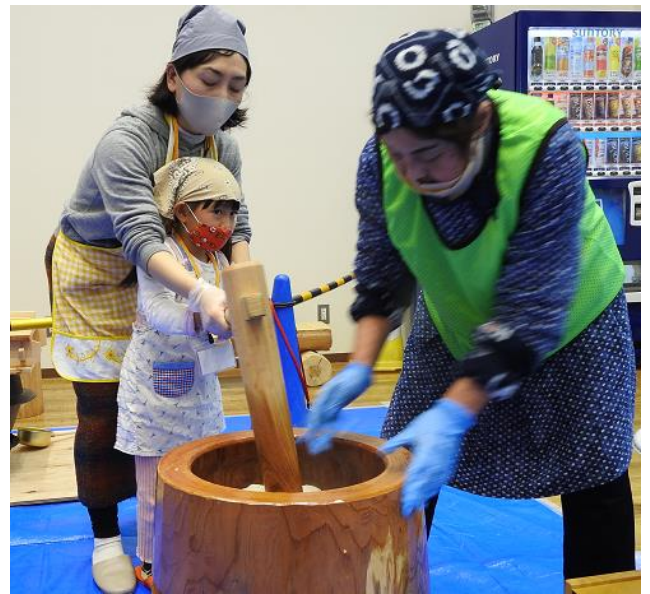
【うっ！ 思ったより重いぞ！ でも楽しい！】