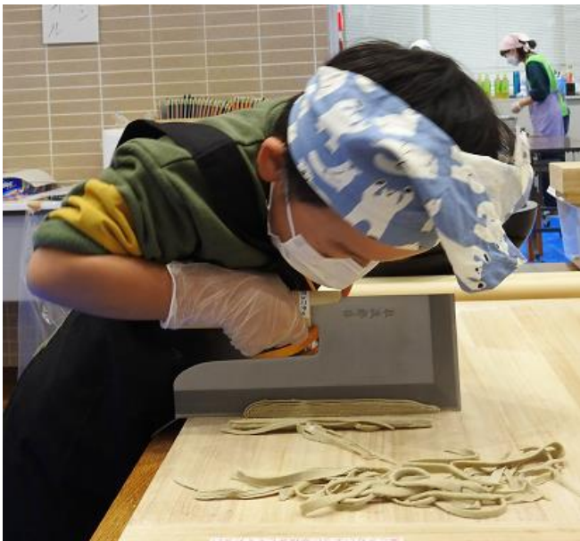
【同じ細さに、同じ…！ きしめんにはしないぞ！】