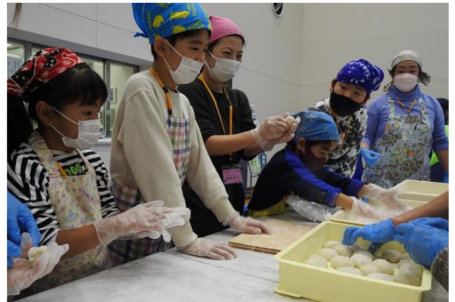
【ついたもちをまるめます。きれいにまるめてよ！】