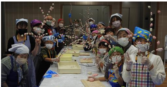
【五穀豊穡を願って、もち花が出来ました！】