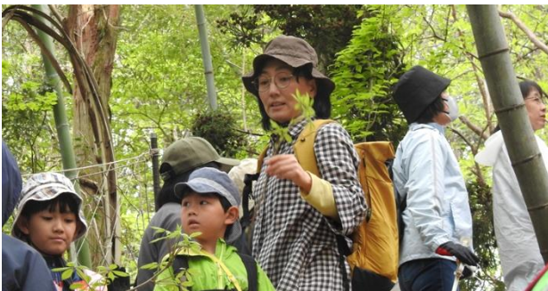
これはタカノツメです