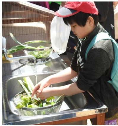
ていねいに洗おう