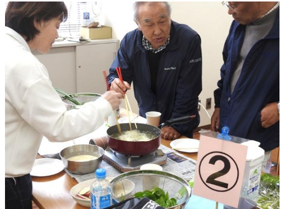
カラッと揚げますよ