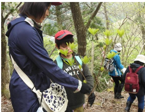
これはリョウブです