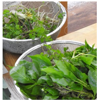
採取した山菜です