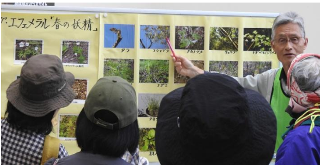
山菜についてアドバイスです

2026年4月18日（土）クリーンパーク北但で、環境学習イベント「山菜の天ぷらを味わおう」を開催しました。敷地内にある「ふれあいの森」や「里の恵みビオトープ」で山菜採りを楽しみ、その後、天ぷらにして食べました。遊歩道での散策の中でコシアブラやタカノツメ、リョウブなどの木の芽を採取し、里の恵みビオトープでタラの芽やセリ、タンポポ、ヨモギ、ドクダミなどの山菜採りを行いました。