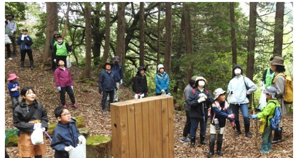
コシアブラの大木「見上げるしかないよ」