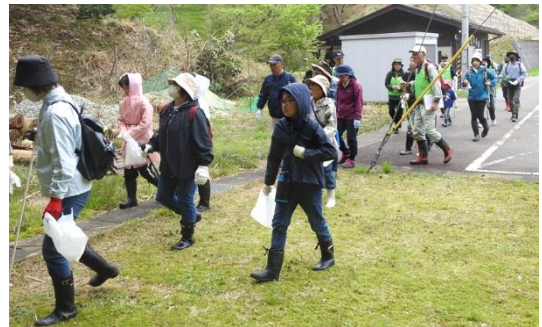
さあ、散策路に向けて出発です